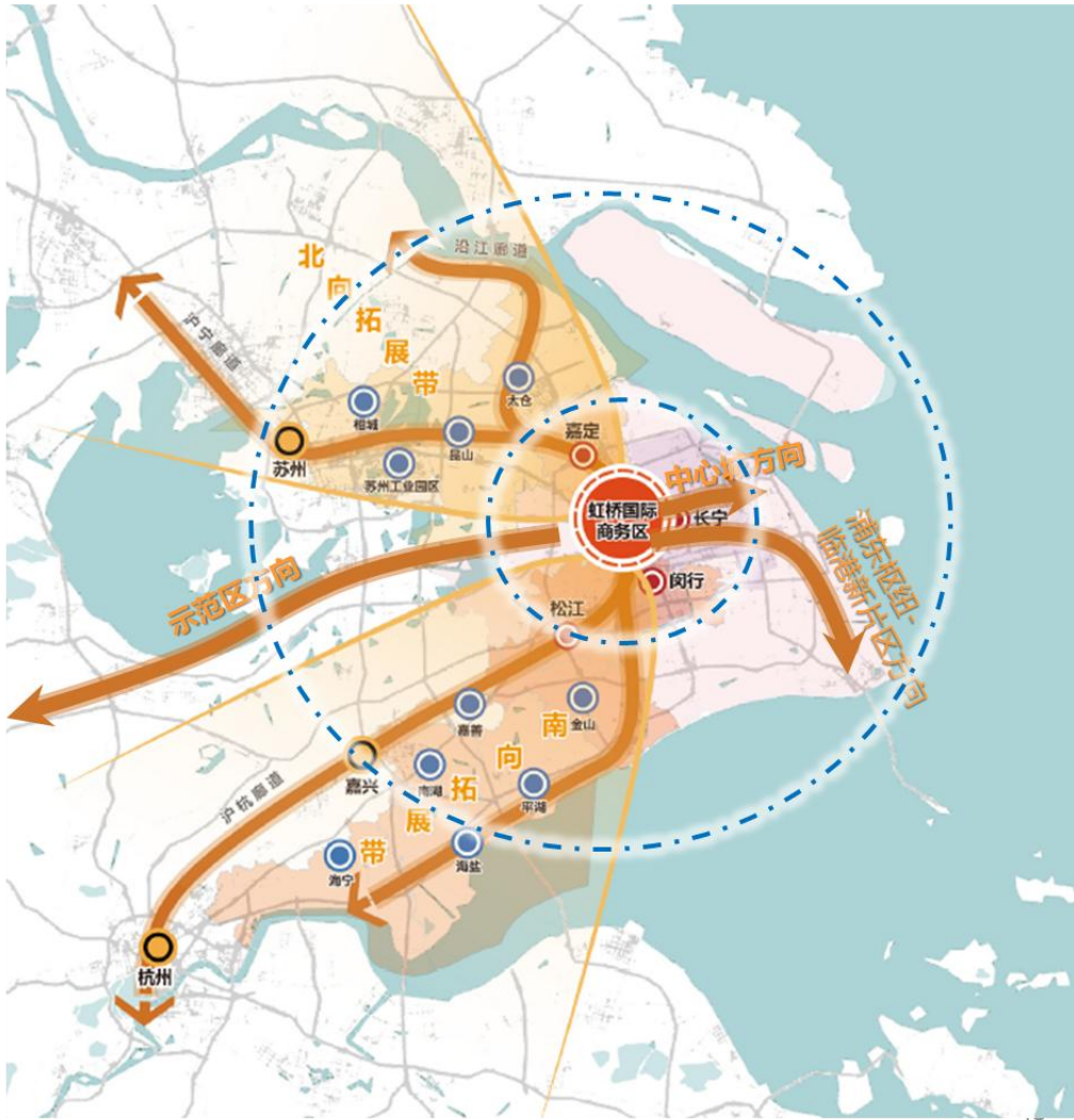
图 3 五向辐射的对外通道规划布局图